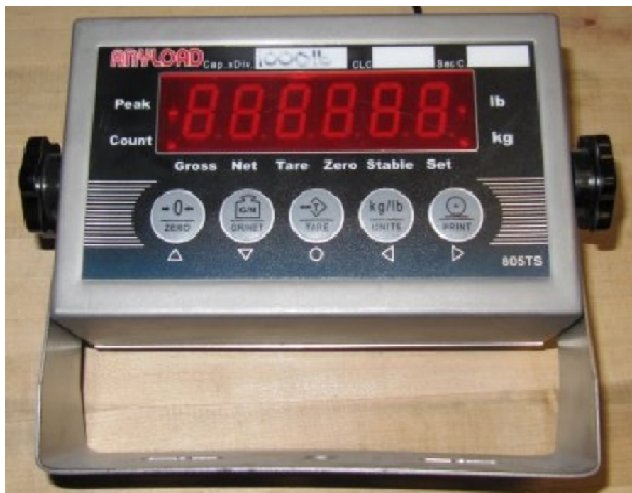
Typical model 805TS / Modèle 805TS typique